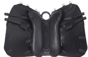
Colore cuciture / Colour of stitching