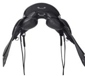
Colore cordoli / Colour of trim