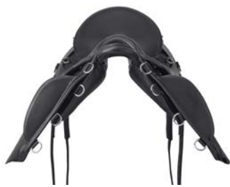
Colore pelle sella / Leather colour of the saddle